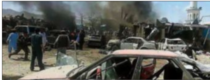
Grymheterna i Afghanistan pågår fortfarande.

Skriv till oss på inkorgen@aftonbladet.se . Du kan använda signatur, men ange namn i kontakt med redaktionen. Skriv kort - vi förbehåller oss rätten att redigera insänt material.