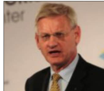
Carl Bildt.