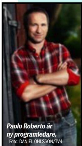
Paolo Roberto är ny programledare.