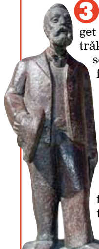
En annan staty av Palm.

– Eftersom platsen är väldigt kal och trist tycker jag det vore att sätta upp en staty av August Palm där. Det vore dessutom pedagogiskt för Malmöborna, som borde betänka hur levnadsförhållandena var här i trakten för 100 år sedan, skriver Malmöbon i ett mejl till Ilmar Reepalu .