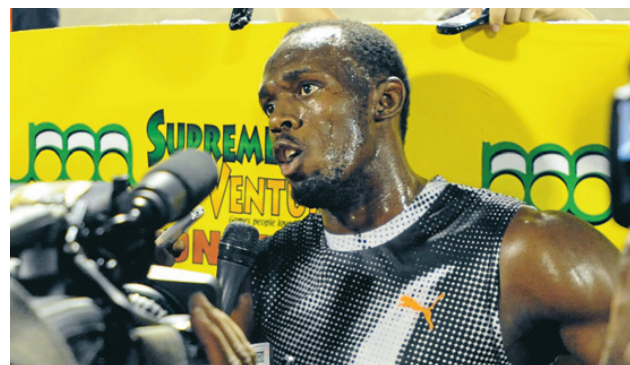
Usain Bolt är en av de allra största stjärnorna i London-OS.

En som både är regerande svensk mästare i parallellslalom och näst bästa junior i