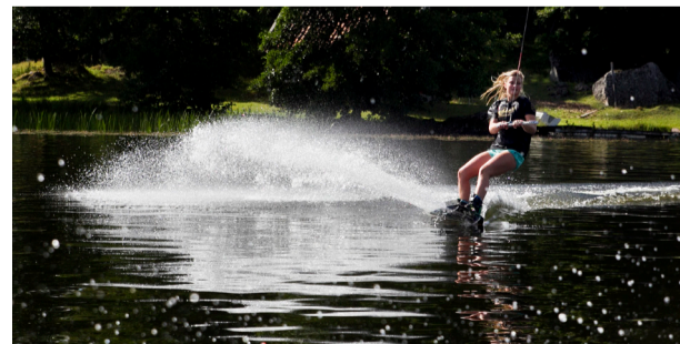
Fart. Fort går det när Djupsjö flyger fram på sjön.