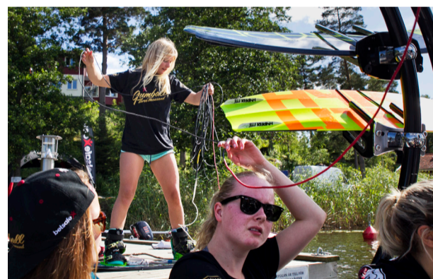
Styr. Stjärnan har klart för sig vad som behöver göras.